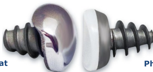
Phalangeal Inlay Implantat